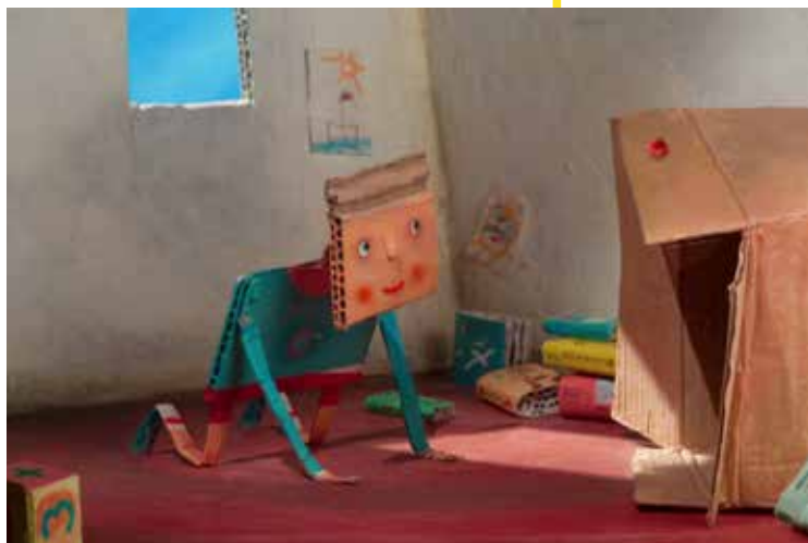
Dodu The Cardboard Boy (2010), José Miguel Ribeiro