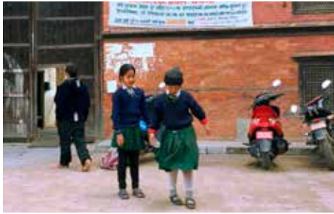
Chunggi (2017), Francis Alÿs

Eye Filmmuseum bewaart heel veel films, ze vormen de collectie van het museum. Maar waarom bewaren we films? En waarom is dat belangrijk? In deze gastles denken de leerlingen na over filmisch erfgoed en onderzoeken ze het aan de hand van het thema school.