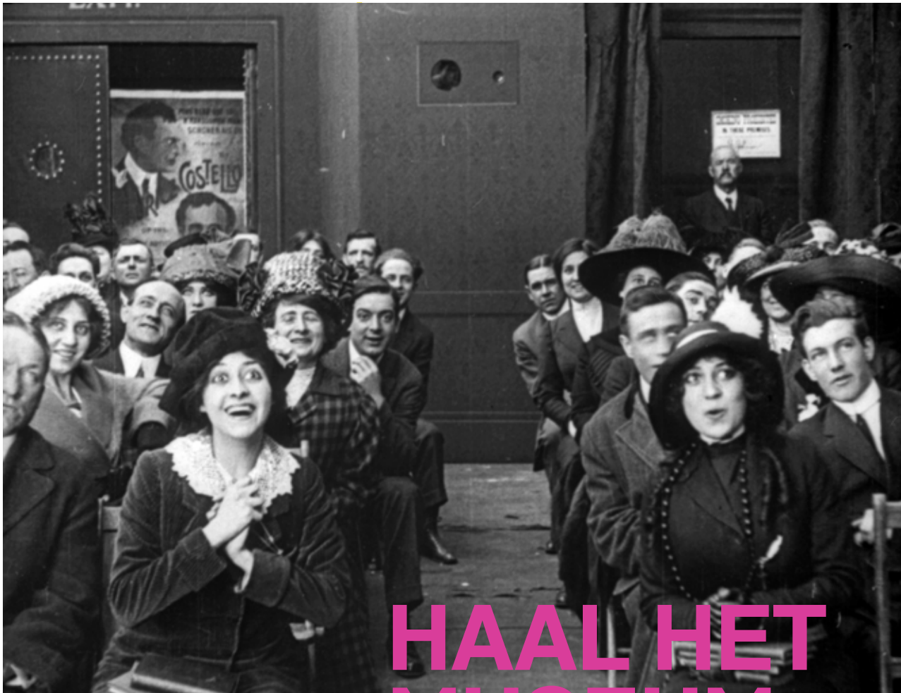
The Picture Idol (1912), James Young

Eye Filmmuseum is de schatbewaarder en het filmgeheugen van Nederland en laat leerlingen met deze gastlessen de waarde en betekenis van filmisch erfgoed zien.