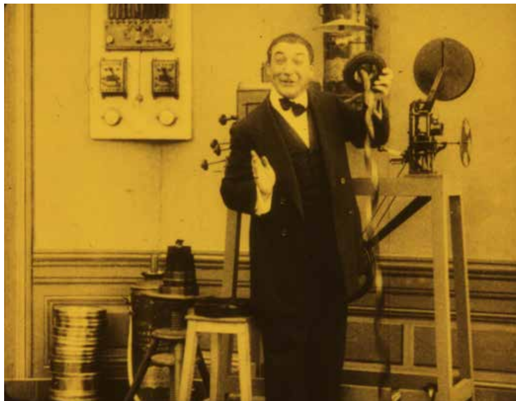
Arthème opérateur (1913), Ernest Servaes

Boek nog voor de zomervakantie een gastles en maak automatisch kans op een gratis rondleiding voor jouw klas in Eye Filmmuseum